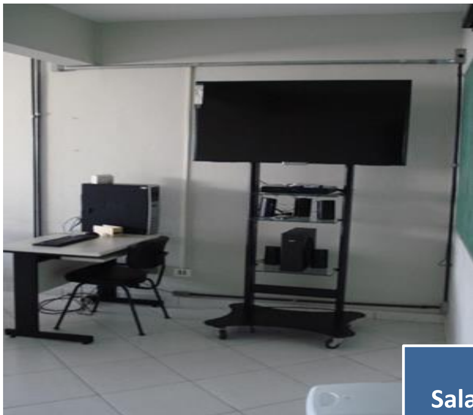
Sala LIFE 03 – Sala Multimídias