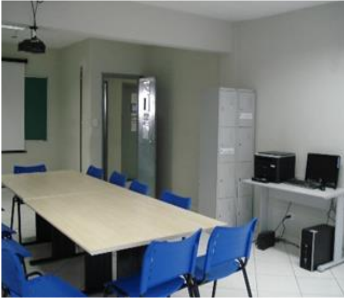
Sala LIFE 01 – Sala de Apoio ao Estágio Supervisionado, Extensão, PIBID e Prodocência