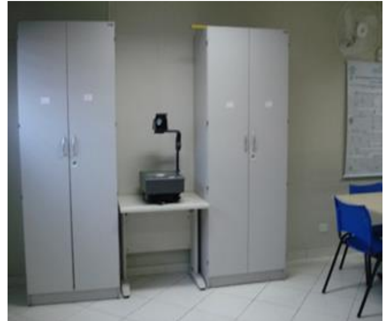
Sala LIFE 02 – Sala de Estudos e Acervo de Livros